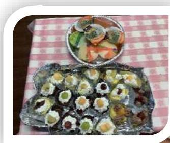
ケーキバイキング