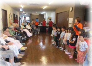
認定こども園和光の年長さん