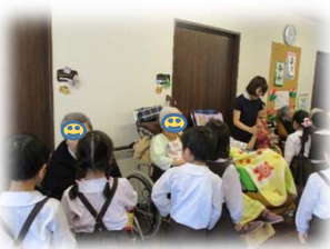
カルメン幼稚園の年長さん

5月はカルメン幼稚園と認定こども園和光の園児達がみんなのさとに遊びに来てくれました。かわいいお客様に皆さん表情が和らいでいました。当日誕生日の利用者には可愛いお花のプレゼントまでいただきました。