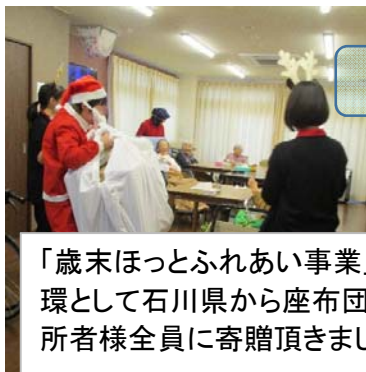
サンタさん登場(笑)

「歳末ほっとふれあい事業」の一環として石川県から座布団を入所者様全員に寄贈頂きました。