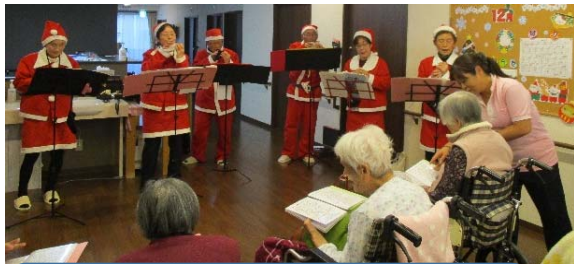
オカリナ演奏会☆12/17(水)☆ (ハッピーバードの皆さん)

新年あけましておめでとうございます。新しい年を迎え皆様いかがお過ごしでしょうか。今年一年入居者様が健やかな日々を送ることができるよう職員一同心を込めてお手伝いをさせていただきますのでよろしくお願いいたします。